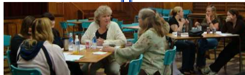
New Glasgow, NS: Participants at workshop for Women/Participant à l'atelier pour femme

This project, funded by Status of Women Canada, had as main objective to provide tools and information related to financial education of women in coastal communities in the Southern Gulf of St. Lawrence. Rural women had the chance to participate in different financial education activities to enhance their capabilities in managing their finances during four workshops that took place in autumn 2009 in Moncton (NB), New Glasgow (NS), Charlottetown (PEI) and Cap-aux-Meules (QC). This project has enabled the Coalition-SGSL to deepen relationships with groups focused on the welfare of women in the region, and increase the participants individual capacity to contribute to the sustainability of their communities. The report and videos resulting from this project will soon be available on the Coalition-SGSL's website.