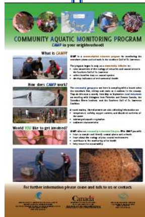
CAMP Portable Signs / Affiche portable PSCA

It has been a busy year for CAMP. We are happy to have achieved all the goals set early last year, despite a lack of funding for the community groups. This work would not have occurred without the tremendous support and willingness of these groups, and the partnership of the Gulf Fisheries Center and the Atlantic Ecosystem Initiative. Since CAMP is at such a crucial time and has had such a phenomenal year, the Annual General Meeting on June 12 will have a whole section devoted to the review of CAMP data and the next steps. We invite all CAMP groups and volunteers to attend the AGM and take this opportunity to be informed and inform others on the future of the program.